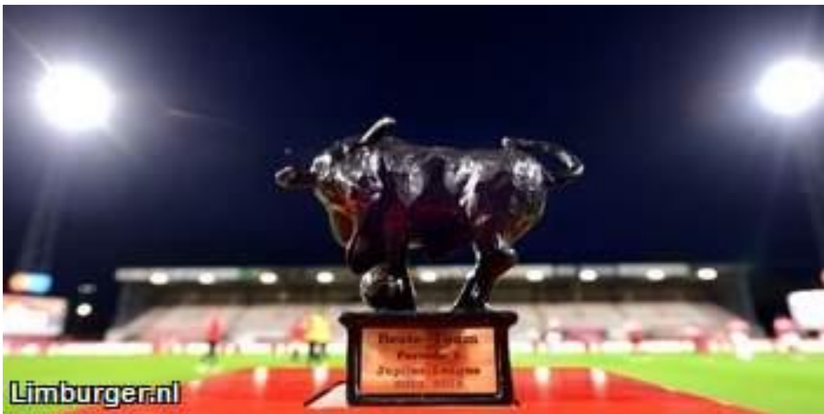
De Bronzen Stier voor Beste Team in de 1 o Periode